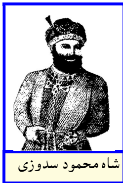
شاه محمود سدوزی

دا ځلي د محمود مور شاه زمان ته د محمود شفاعت و کړ او شاه زمان محمود بیرته د هرات حکمران کړ او بلخ ئې هم د بخارا د اوزبکانو څخه و نیو.