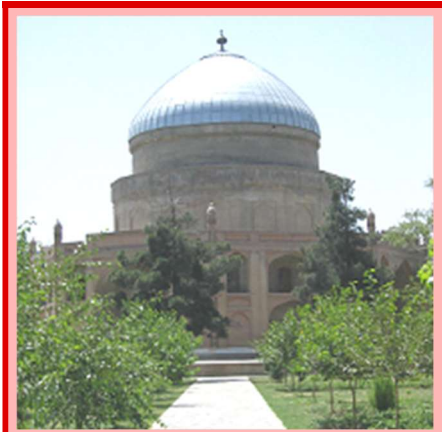
د تیور شاه قبر په کابل کې

تېمورشاه ۲۴ زامن درلودل او هیواد ئې د دوی تر منځ په لاندې ډول و وېشی: