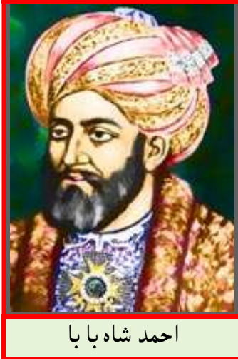
احمد شاه بابا

احمد شاه بابا په اصل سدوزی او د پلار نوم ئې محمد زمان خان وو. احمد شاه بابا په ۱۱۳۵ هـ ق ۱۷۲۲ م کال کې زېږېدلی دی. پلار ئې د هرات مشر وو. د مور نوم ئې زرغونه اناوو چې په خټه الوکوزی وه. مور ئې په پښتونولي د خپل زوی روزنه وکړه او ننګيالی ئې لوی کړ.