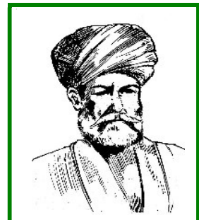
وزير فتح خان

کله چې شاه زمان د شاه محمود او وزير فتح خان له خوا ماته و خوره. شاه محمود پاچا سو. شاه محمود چې يو ډېر عياش پاچا وو په خپله ئې هيڅ کار نه کاوه نو د حکومت چاري ئې وزير فتح خان او د هغه ورونيو ته پرېښودې. نو شاه شجاع چې د شاه زمان سکنی ورور وو او پدغه وخت کي په پېښور کي وو، له دې ناوړي پېښي څخه خبر سو نو سمدستي ئې لښکر برابر کړ او د کابل پر لور را رهي سو. شاه محمود هم له ۳۰۰۰ درو زرو عسکرو سره د ده و مخ ته ورووت او شاه شجاع ماته وکړه ۱۲۱۶ هـ ق ۱۸۰۱ م.