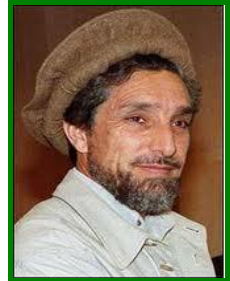
احمد شاه مسعود

د رباني صاحب دغه کار د گلبدين حکمتيار حوصله نوره پای ته و رسوله. هغه وو چي د ده او گلبدين حکمتيار تر منځ خونړۍ جگړې را پورته سولې. د دغو جگړو له امله کابل ويران سو او په کابل کي په زرو انسانان و وژل سول.