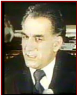
حفيظ الله امين

حفيظ الله امين د ۱۹۲۹ م کال د اگست پر لومړۍ نېټه د پغمان ولسوالۍ د قاضي خېلو په کلي کې نړۍ ته سترگي خلاصې کړي دي. وروسته تر دې چې د کابل پوهنتون د ساينس د پوهنځي د رياضي او فزيک په څانگه کې ئې تحصيل وکړ په يوه لېسه کې ئې د ښوونکي په توگه په کار پيل وکړ. په ۱۹۵۷ م کال کې ئې د امريکې متحده ايالاتو ته د لوړو زده کړو لپاره سفر وکړ. د تحصيل تر پای ته رسولو وروسته د کابل د ښوونکو د روزلو په موسسه (دارالمعلمين) کې د ښوونکي په توگه په کار بوخت سو. په ۱۹۶۲ م کال کې ئې يو ځل بيا د لوړو زده کړو لپاره امريکا ته سفر وکړ. دا ځلي د دې پر ځای چې زده کړي وکړي په سياست لگيا سو. کله چې هيواد ته را ستون سو د خلق د ديموکراتيک گوند غړی سو. نوموړی د نور محمد ترکي تر مړني وروسته د افغانستان د درېيم اولسمشر (جمهور ريس) او د خلق د ديموکراتيک گوند مشر سو.